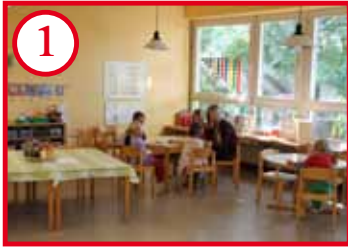
1 Grünes Zimmer / Kreativbereich (Stammgruppenzimmer)

Die vorbereitete Umgebung bietet den Kindern Anreize zum Lernen, Erforschen, Experimentieren und Spielen in verschiedenen Bildungs- und Entwicklungsfeldern.