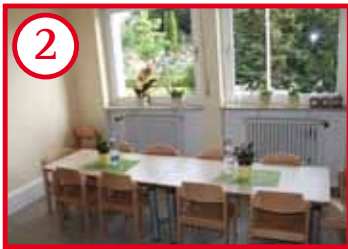
2 Bistro / Esszimmer