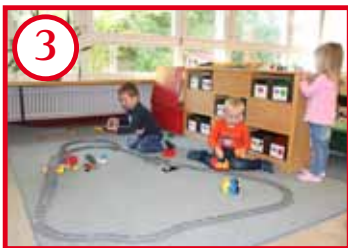
3 Blaues Zimmer, Bauen & Konstruieren (Stammgruppenzimmer)