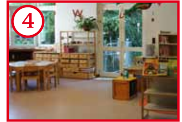
4 Gelbes Zimmer, Sprache & Zahlen (Stammgruppenzimmer)