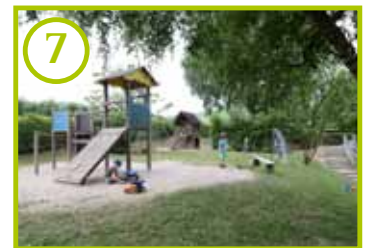
7 Außengelände (Ü3)