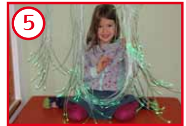
5 Ruhe- & Schlafräum