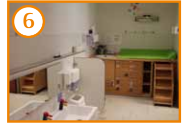
Wasch- und Wickelraum