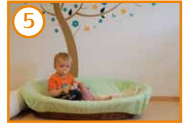
Schlaf- und Ruheraum