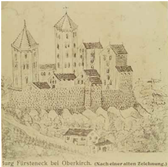
Burg Fürsteneck bei Oberkirch. (Nach einer alten Zeichnung.)

Die Baugeschichte und die Geschichte der Burgherrschaft hängen eng mit der Geschichte der Stadt Oberkirch zusammen: Die Schauenburg, welche die Herzöge von Zähringen zur Sicherung der wichtigen Kniebiswegverbindung erbaut hatten, war zu Beginn des 12. Jahrhunderts als zähringisches Heiratsgut ihrer unmittelbaren Besitzherrschaft entglitten. Als Ersatz dafür förderten sie den Ausbau Oberkirchs, das sie selbst oder ihre Erben durch die Errichtung einer neuen, südlich der Rench gelegenen Burg militärisch absicherten. Diese wohl noch im 12. Jahrhundert entstandene Burg, die in